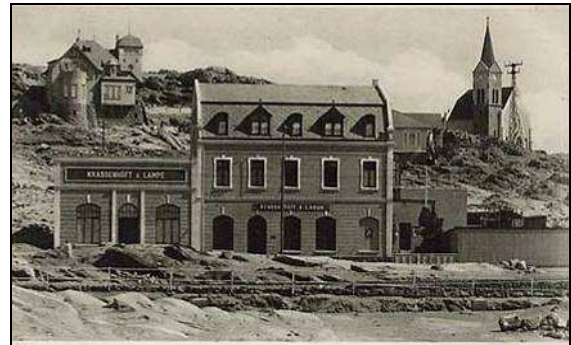
Abb. 3: Lüderitzbucht auf einer zeitgenössischen Postkarte mit der 1910 erbauten „Felsenkirche“

Er hörte auf dieser Festveranstaltung davon, dass ein Ölgemälde von Ernst Vollbehr sich noch in Lüderitz befinden sollte und machte sich auf die Suche nach dem Bild, um es eventuell für seine Sammlung zu erwerben.