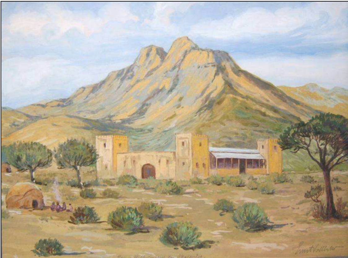
Abb. 4: „Kaiser Wilhelmsberg bei Okahandja, S.W.A.“, Ernst Vollbehr, ca. 1910